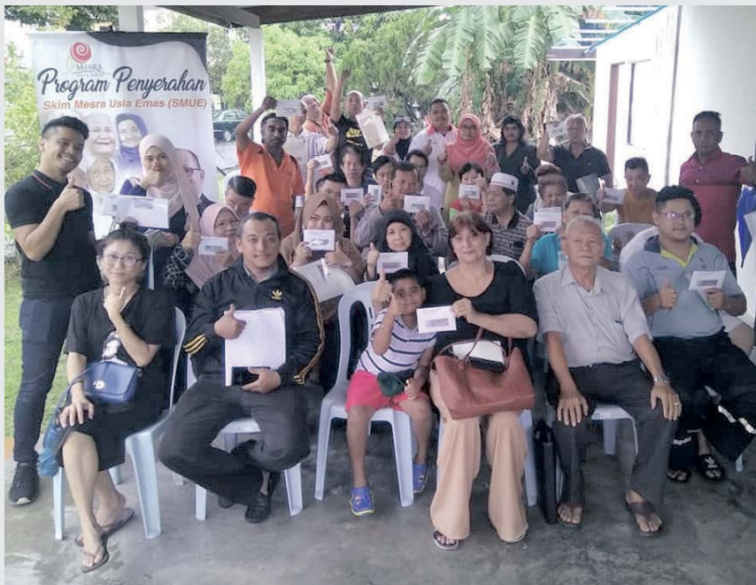
Waris yang menerima SMUE berterima kasih kepada kerajaan negeri.