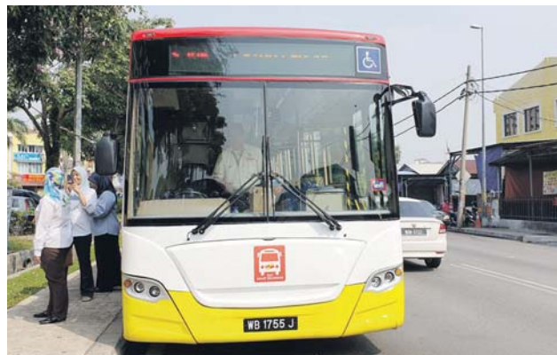
Warga asing yang menggunakan perkhidmatan bas Smart Selangor akan dikenakan caj selepas ini.

negeri menyedari kebanyakan pelajar tidak membawa kad pengenalan ketika ke sekolah dan satu kajian juga akan dilaksanakan mengenai perkara itu.