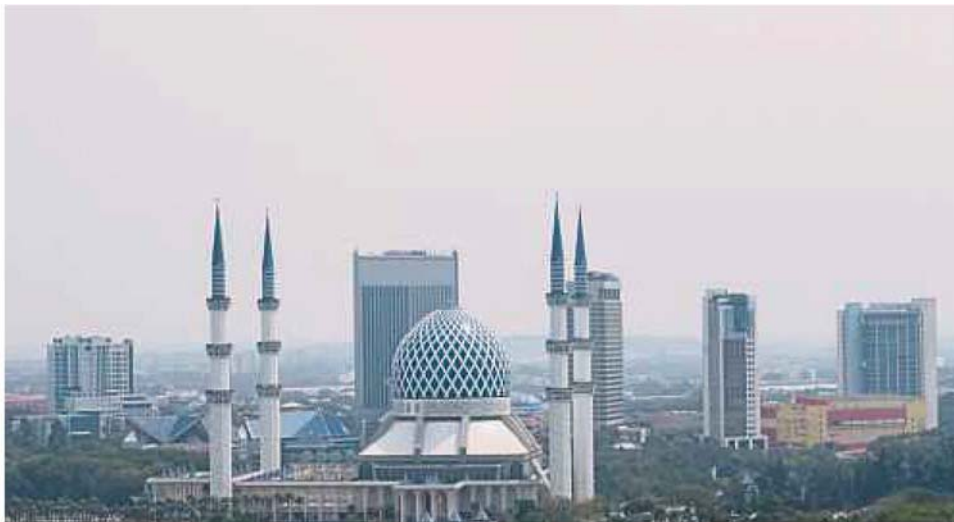
MASJID Sultan Salahuddin Abdul Aziz Shah kelihatan kabur ekoran jerebu melanda di sekitar Shah Alam.