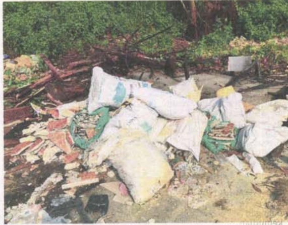
PELBAGAI jenis sampah serta sisa binaan di buang di kawasan berkenaan.

memanjangkan isu berkaitan kepada Majlis Perbandaran Subang Jaya (MPSJ) dan pemasangan papan tanda larangan telah dilakukan namun keadaan masih berterusan.