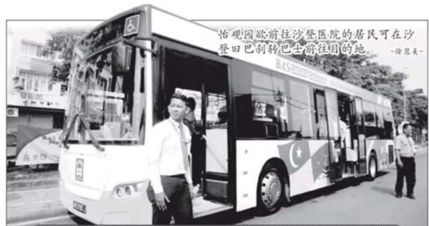
怡观园欲前往沙登医院的居民可在沙登旧巴刹转巴士前往目的地。 -徐思美-