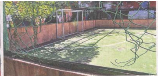
Many of the facilities cannot be used as they are in a state of disrepair.