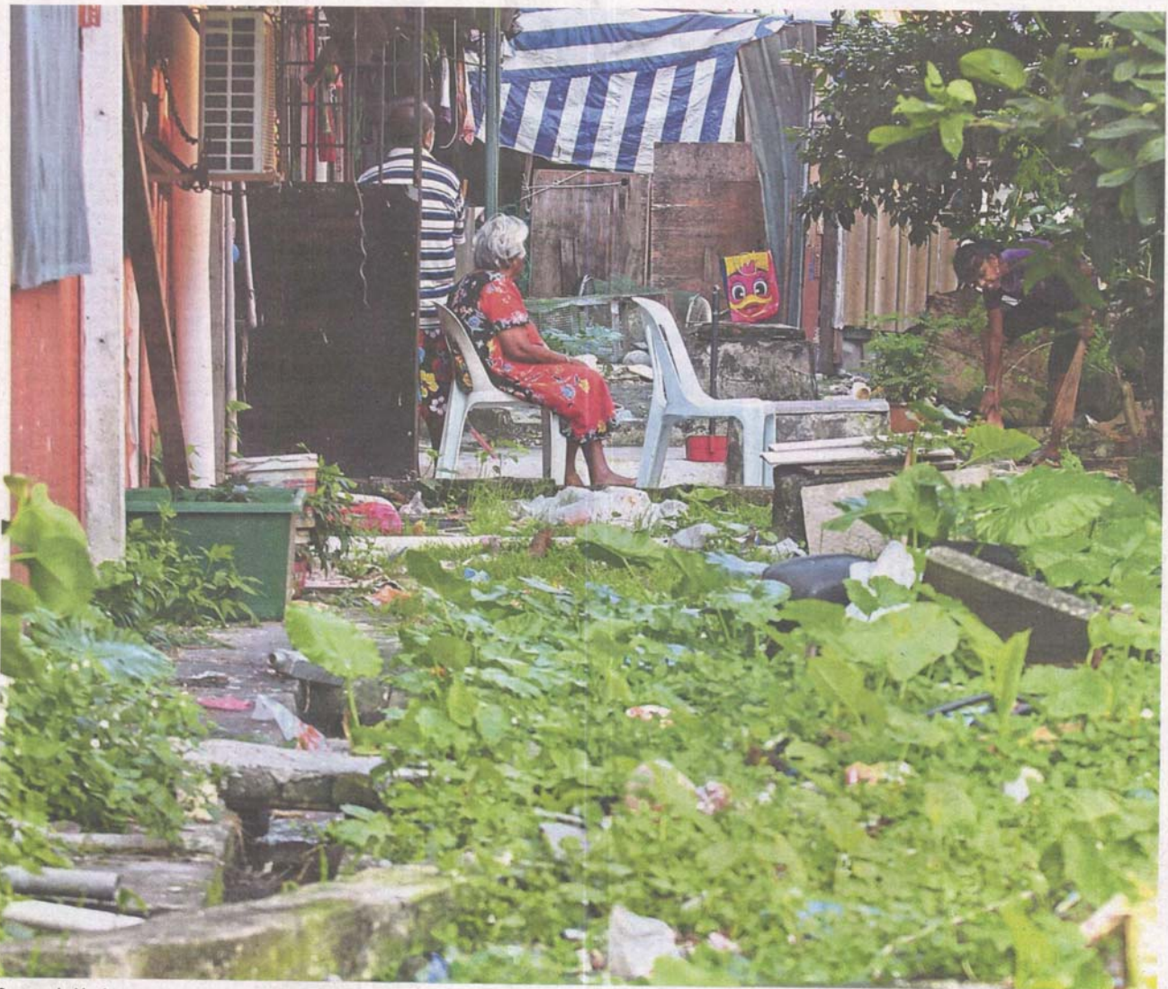
Surrounded by issues: Taman Desaria residents have to put up with a poor living environment.

Residents of Taman Desaria in Petaling Jaya are struggling to deal with numerous problems afflicting them at the low-cost flats. >2&3