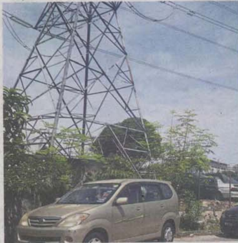
Residents are worried that the wire mesh fence may become a conductor for lightning during a storm.

Low collection of monthly fees results in a host of problems