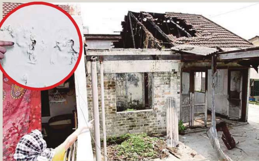
ANGIE menunjukkan rumah terbiar tanpa penghuni sejak lima tahun lalu. Gambar kecil, kesan lembap dan merekah di bahagian bilik tidur.

"Lama kelamaan rumah itu dipenuhi semak samun dan bimbang akan menjadi sarang binatang berbisu-