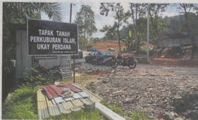
The Ukay Perdana Muslim cemetery is open ahead of schedule.

He added that the cemetery was supposed to be completed by the end of March, but the opening was expedited because other cemeter-