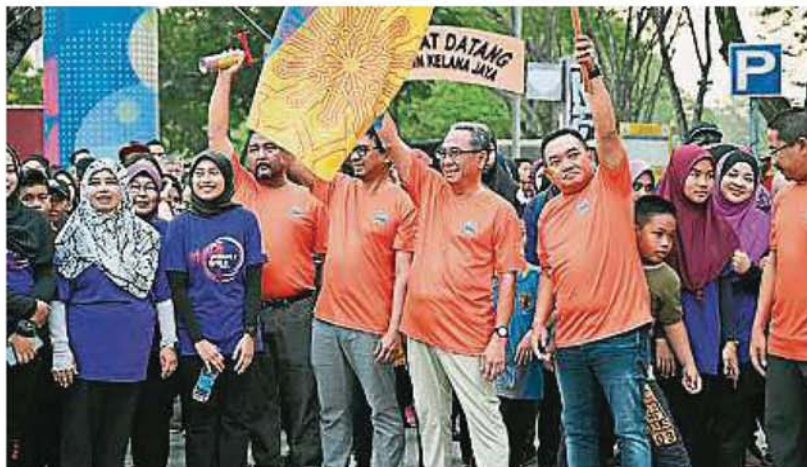
八打灵再也市长拿督阿兹兹（左五）为紫色行主持挥旗仪式。

当天举办多项活动，包括智能游乐设施、紫色行、钓鱼比赛、传统游戏比赛及填色比赛等，适合一家大小参与。