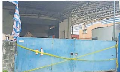
尽管工厂已于一周前遭查封, 惟业者竟然可以持续内部作业, 无视当局指令。