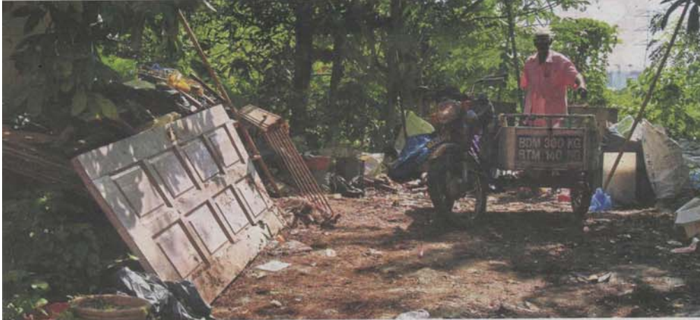
An illegal dumping ground at the compound of the Taman Desaria flats.