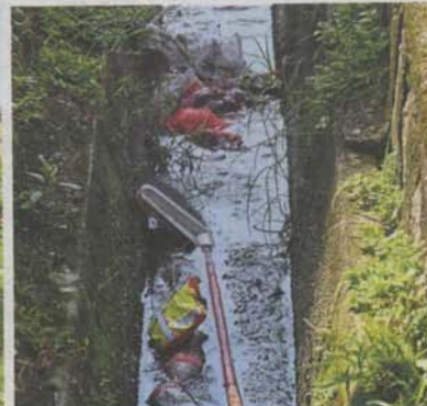
Clogged drains contribute to the foul smell in the area.