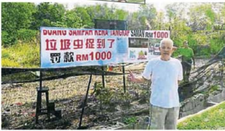
一名居民对居协的工作赞好。