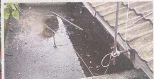
Stagnant water at the rooftop are potential breeding grounds for mosquitoes.

us for the clogged toilets but it is not our fault as there is no maintenance being carried out at all.