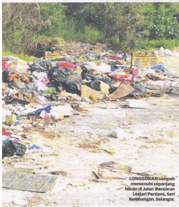
LONGGOKAN sampah memenuhi sepanjang laluan di Jalan Persiaran Lestari Perdana, Seri Kembangan, Selangor.