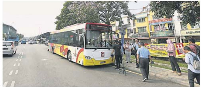
SJ05 路线连接怡观园至沙登巴利及沙登医院，途经学校、巴利、商业区及未来的沙登捷运站。