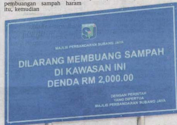
PEMASANGAN papan tanda larangan membuang sampah tidak dipedulikan mereka yang terlibat.