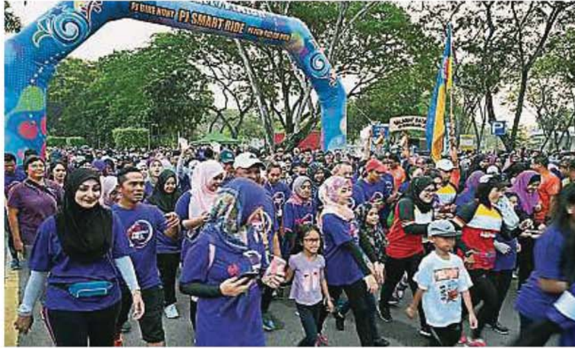
配合八打灵再也无车日，民众参与灵市政厅举办的紫色行。

Provided for client's internal research purposes only. May not be further copied, distributed, sold or published in any form without the prior consent of the copyright owner.