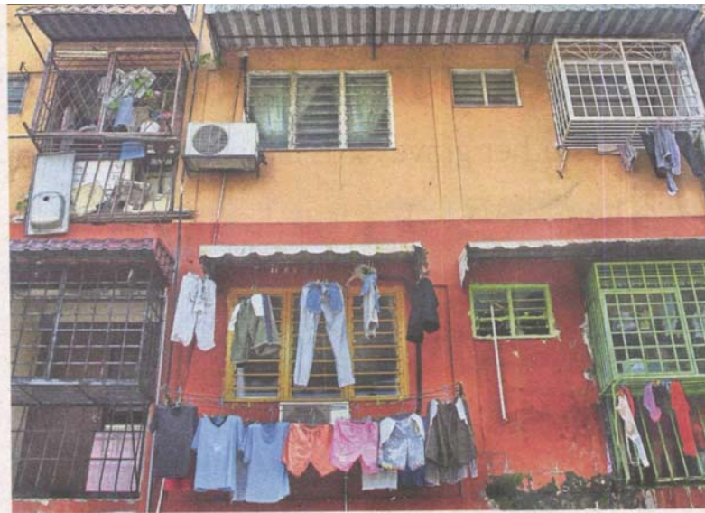
The poor collection of maintenance fees contribute to the unkempt surroundings.