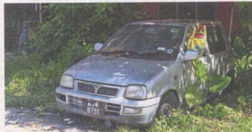
Abandoned vehicles are a common sight at the Taman Desaria flats.

The day before StarMetro's visit, one of the fuses blew out leaving a