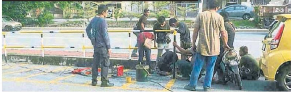
■莲花苑州议员服务中心对面的摩哆车泊车位将增设栏柑。