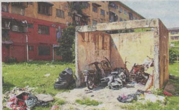
Abandoned motorcycles taking up space meant for rubbish disposal.

The host of problems has also led to friction among neighbours. "One of our neighbours scolded